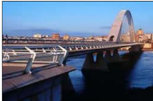
Puente Lusitania. Mérida

Avanzado el siglo XX comienzan a aparecer múltiples expresiones modernistas en el apartado arquitectónico reflejándose en edificaciones civiles como museos (Museo Nacional de Arte Romano de Mérida o MEIAC de Badajoz), en puentes (Lusitania de Mérida, Real de Badajoz), mercados de abastos, viaductos, etc.