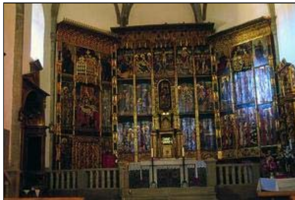
Iglesia Parroquial del Divino Salvador. Calzadilla de los Barros.

Existen imágenes de gran valor histórico-artístico: la Virgen del Sagrario, Santa María la Blanca y Santa María del Perdón. Como obra pictórica del siglo XVI sobresale la Boda de Caná.