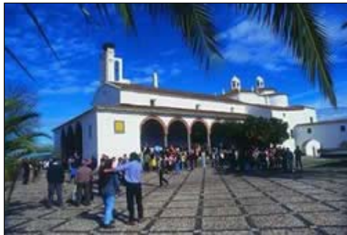
Ermita de la Virgen de los Remedios. Fregenal de la Sierra

Los retablos representan toda la grandiosidad de la escultura. Algunos son: