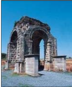
Arco de Cáparra