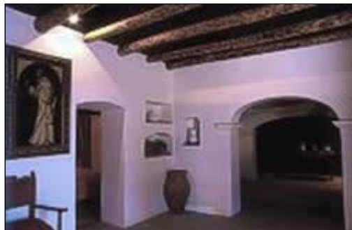
Casa Museo de Zurbarán. Fuente de Cantos

En el arte pictórico , Francisco de Zurbarán es el genio de esta época. Sobresale su estilo naturalista, dominando la luz y el carácter religioso de su pintura; es el pintor de los frailes. Algunas de sus obras son: San Buenaventura, Adoración de los pastores, Tentaciones de San Jerónimo, Fray Alonso de Illescas, etc.