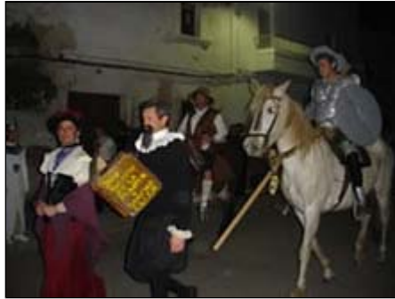
Fiesta del Carnaval

En Extremadura destacan por su colorido los carnavales de Badajoz , de Campo Arañuelo (Navalmoral de la Mata) y de El Peropalo (Villanueva de la Vera) donde un monigote representa a un malhechor que es ajusticiado, siendo manteado y quemado. Comienzan los festejos el domingo de quincuagésima hasta el martes de carnaval.