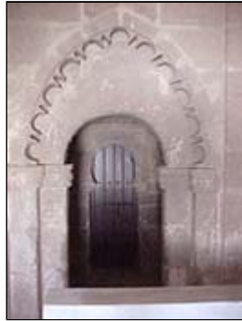
Torre mudéjar. Iglesia de Ntra. Sra. De la Granada. Llerena

Llerena es una población donde abundan las construcciones de estilo mudéjar: Plaza Mayor, Palacio del Obispo, Iglesia de Nuestra Señora de la Granada .