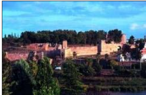
Alcazaba de Badajoz

Alcazaba de Badajoz. Es la mejor conservada de Extremadura, siendo construida como fortificación ante las amenazas portuguesas y del rey de León. La torre más importante es la del Apéndiz (Espantaperros) cuya planta es octogonal.