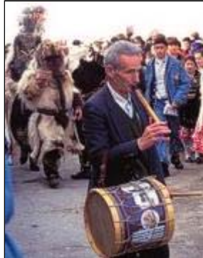
Las Carantoñas. Acehúche

La Santa Cruz (Feria). En la primera semana de mayo se celebra esta fiesta procesional. Es una costumbre de arraigo medieval donde la manifestación religiosa está muy presente.