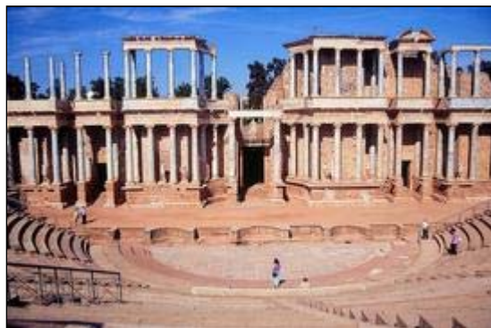
Teatro Romano de Mérida

En Casas de la Reina (Badajoz) se halla Regina que fue un importante núcleo de la época romana. Uno de sus restos es el teatro .