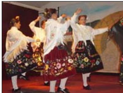
Baile Regional. Arromolinos.

Se traducen en manifestaciones relacionadas con la religión, ritos, luchas guerreras, ciclos agrícolas, folklóricas, etc., ayudando todas ellas a conocer mejor el carácter y costumbres de los pueblos de Extremadura.