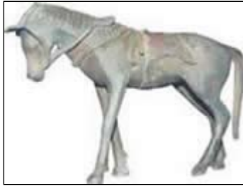
Caballo de Cancho Roano. Zalamea de la Serena

Un exponente de esta época es El Carro de Mérida (siglos VII-VI a. De C.). Muestra una plataforma sobre cuatro ruedas que representa una escena de caza. Aparece un caballo con su jinete, un jabalí y un perro.