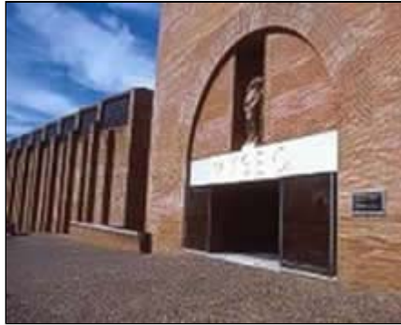
Museo Nacional de Arte Romano. Mérida