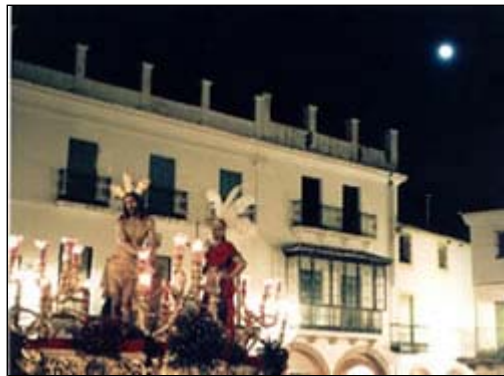
Semana Santa. Zafra

Otras fiestas son las que se celebran el Lunes de Pascua . En Trujillo, es El Chíviri ; en Campanario es la Romería de Piedraescrita y en Arroyo de la Luz es Las Carreras donde jinetes muestran su destreza cabalgando por las calles de la localidad.