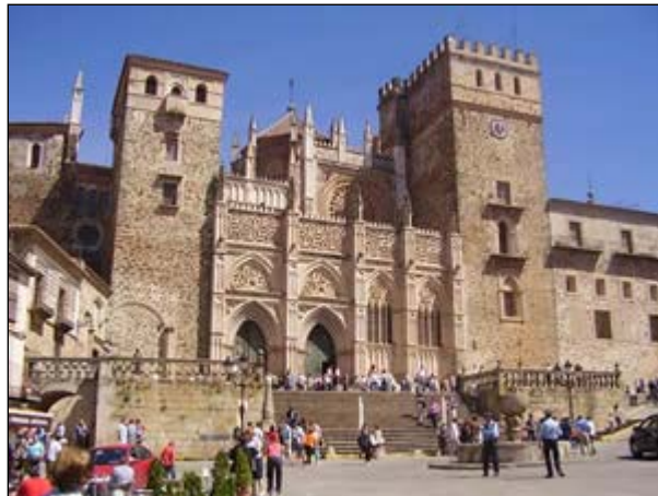
Monasterio de Guadalupe

Real Monasterio de Guadalupe . Es la muestra más sobresaliente de este estilo en Extremadura. Su claustro, de forma rectangular, tiene dos cuerpos de arquería a cada lado; existiendo en su centro un templete que es único en su estilo.