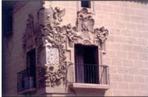
Palacio de Monsalud. Almendralejo