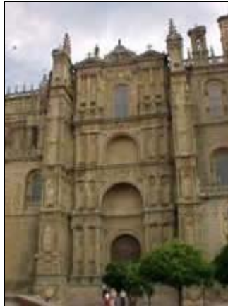
Catedral de Plasencia

Catedral de Coria. Su Portada del Perdón, en la fachada principal, es de estilo plateresco. Tiene cierta semejanza en su parte inferior a la portada de la universidad de Salamanca.