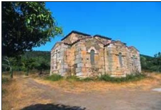
Basílica de Santa Lucía. Alcuéscar.

Los monasterios hispano-visigodos abundaron no solo en el campo sino también en las ciudades. Con el apoyo de los obispos y de la aristocracia local, los monasterios hispanos de los Siglos V y VI se ubicaron preferentemente en las ciudades. Es el caso de la Basílica de Santa Eulalia de Mérida (Badajoz), Basílica de Burguillos del Cerro (Badajoz) y la Basílica de Santa Lucía de Alcuéscar (Cáceres).