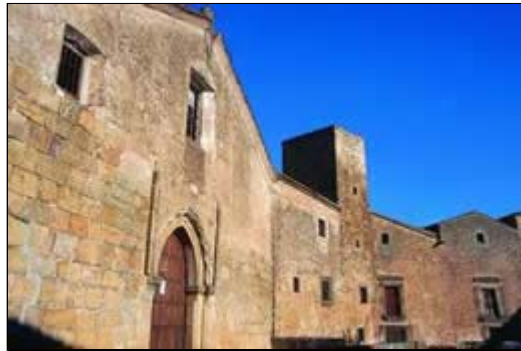
Iglesia de Santiago. Trujillo