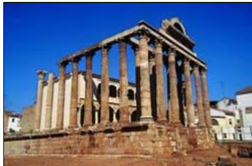
Templo de Diana. Mérida

Las antiguas termas romanas han dado paso a modernos Balnearios aprovechándose el manantial de agua termal. Se localizan en Alange (Badajoz) y Baños de Montemayor (Cáceres).