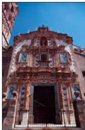
Iglesia de San Bartolomé. Jerez de los Caballeros.